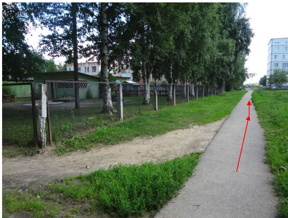
Со стороны улицы Пугачева