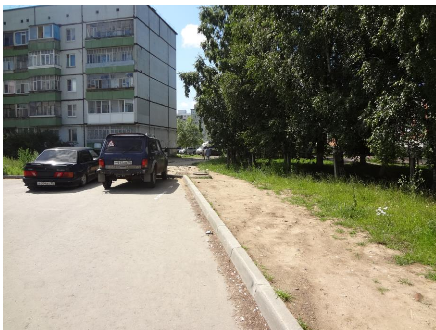
На улице Северной