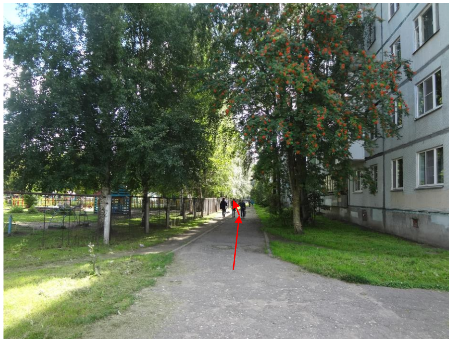
Со стороны улицы К.Маркса