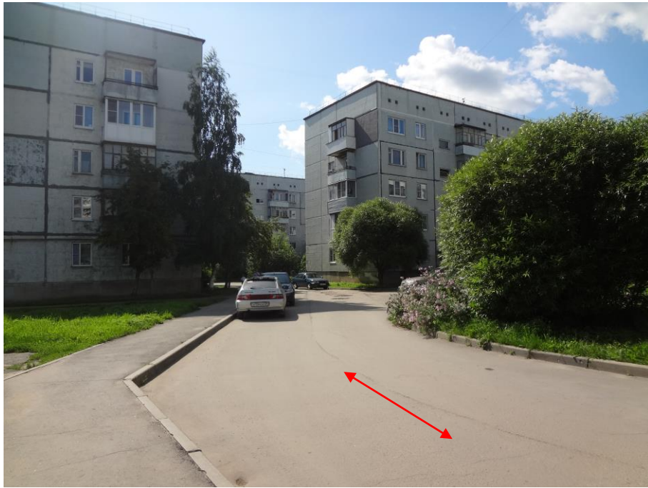
Подходы к детскому саду: Со стороны улицы Северной